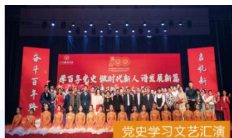
党史学习教育文艺汇演

● 连续三年被评为全省教育系统“规范管理年”“创新发展年”“提升质量年”先进单位；多次被评为江西省安全稳定先进单位；多次被中国纺织工业联合会评为“中国纺织行业人才建设示范院校”；2019 年学校被国家民委授予“全国民族团结进步示范学校”，2014 年至 2020 年学校连续七年荣获全省平安建设（综治工作）先进单位。