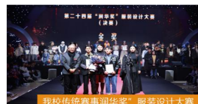
我校传统赛事润华奖“服装设计大赛”