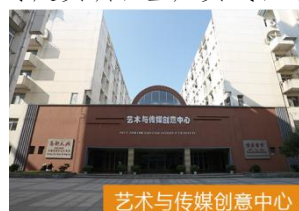
艺术与传媒创意中心

● 学校建有近 6 万平方米的服装创意设计中心、服装工程技术中心、艺术与传媒创意中心、服装博物馆等多个实践教学基地。校企合作共建 237 个校外实践教学基地，各专业的课程实验、专业实验实训、项目专题实训、生产实践、综合实践、毕业实习等实践教学均能得到保障。