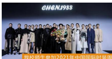
我校师生参加2021年中国国际时装周